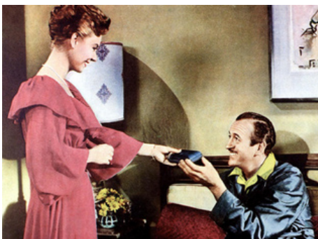
1959 JOYEUX ANNIVERSAIRE (Happy Anniversary) de David Miller avec David Niven