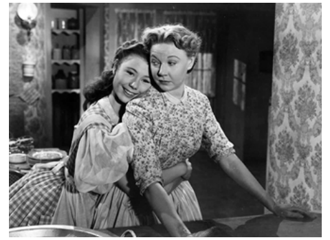
1951 UNE FILLE EN OR (Golden Girl) de Lloyd Bacon avec Una Merkel