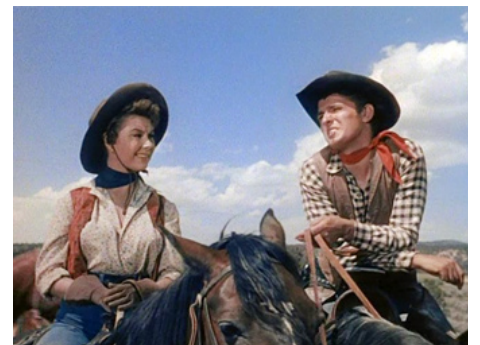
1954 ATTAQUE À RIO GRANDE (Three Young Texans) d'Henry Levin avec Jeffrey Hunter