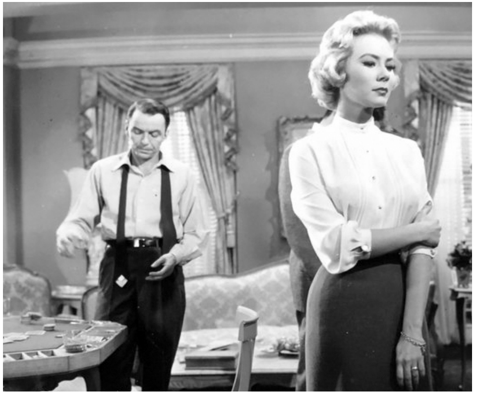
1957 LE PANTIN BRISÉ (The Joker is Wild) de Charles Vidor avec Frank Sinatra