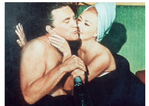
1963 TROIS FILLES À MARIER (For Love or Money) de Michael Gordon avec Kirk Douglas