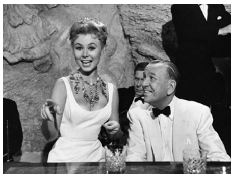
1960 UN CADEAU POUR LE PATRON (Surprise Package) de Stanley Donen avec Noel Coward