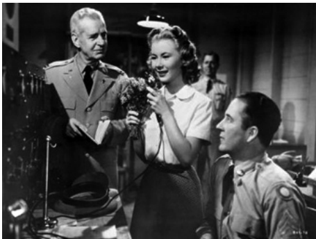
1952 CINQ MARIAGES À L'ESSAI (We're not married) d'Edmund Goulding avec Paul Stewart, John Close