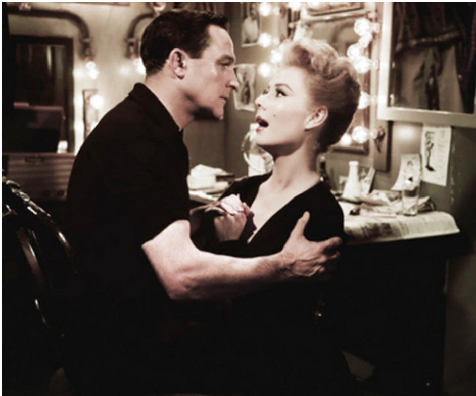
1957 LES GIRLS (The Girls) de George Cukor avec Gene Kelly