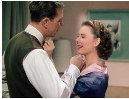
1950 TROIS GOSSES SUR LES BRAS (My Blue Heaven) d'Henry Koster avec Dan Dailey