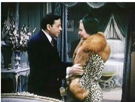
1953 LA FOLLE AVENTURE (The I don't care Girl) de Lloyd Bacon avec Oscar Levant