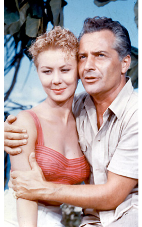
1958 PACIFIQUE SUD (South Pacific) de Joshua Logan avec Rossano Brazzi