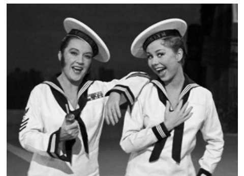
1955 TOUT LE PLAISIR EST POUR MOI (Three for the Show) de H. C. Potter avec Ethel Merman