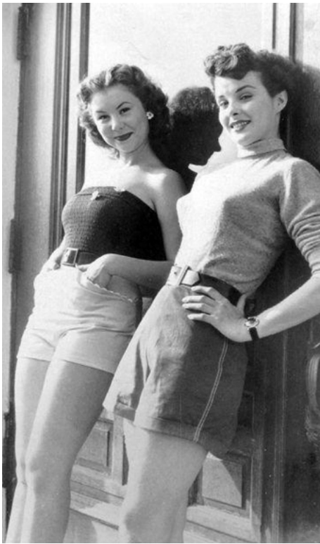
1951 TAKE CARE OF MY LITTLE GIRL de Jean Negulesco avec Jean Peters