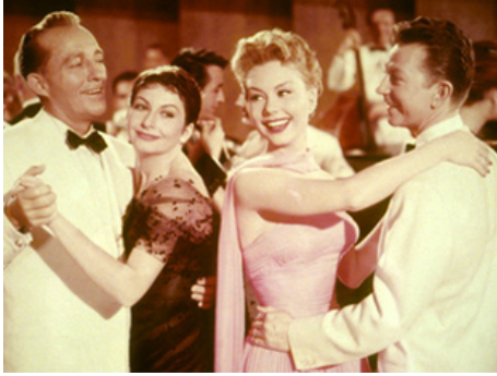
1956 ANYTHING GOES de Robert Lewis avec Bing Crosby, Zizi Jeanmaire, Donald O'Connor