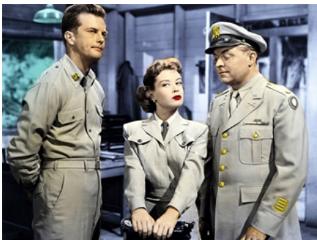
1953 DOWN AMONG THE SHELTERING PALMS d'E. Goulding avec William Lundigan, W. Powell