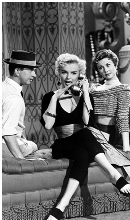
1953 LA JOYEUSE PARADE (There's no Business like Show Business) de W. Lang avec D. O'Connor, M. Monroe