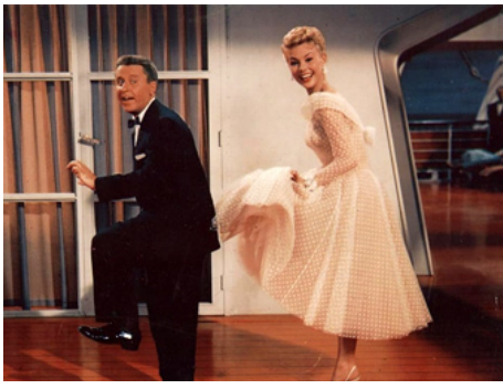
1956 MILLIONNAIRE DE MON CŒUR (The Birds and the Bees) de Norman Taurog avec George Gobel